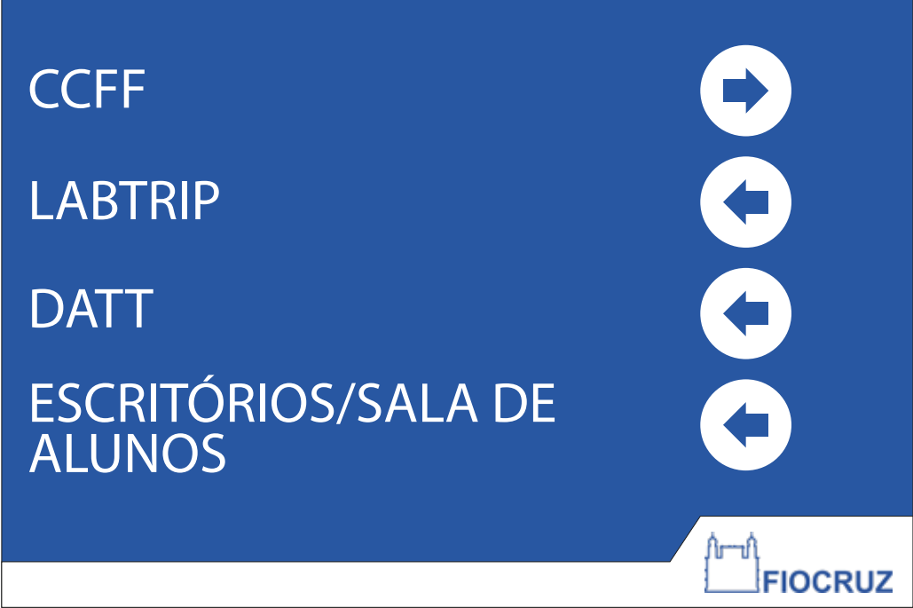
PDI 12 40x60CM